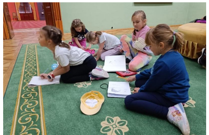
Nejmenší výtvarníci poznávají krásy Kroměříže