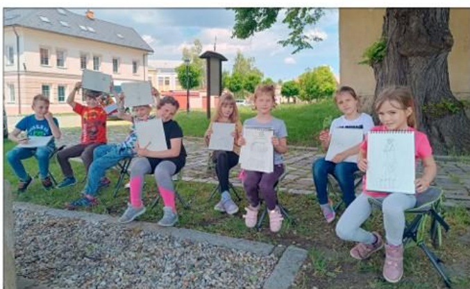
Kreslení v pleněru