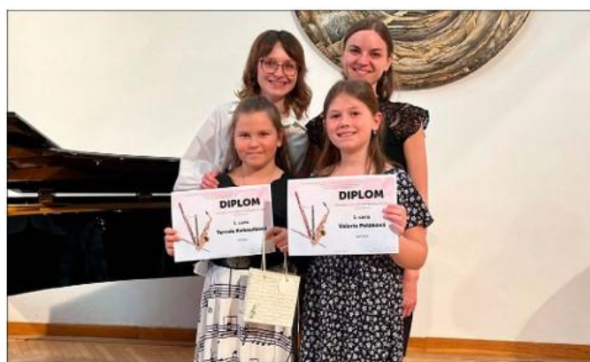
Okresní kolo ve hře na příčnou flétnu