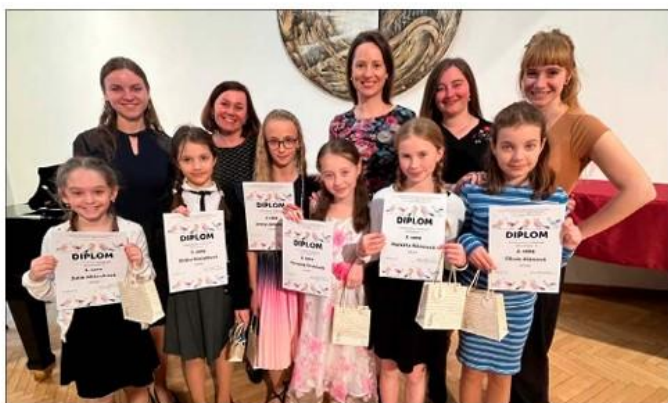
Okresní kolo v sólovém a komorním zpěvu