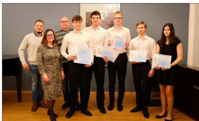
Okresní kolo ve hře na žest'ové nástroje