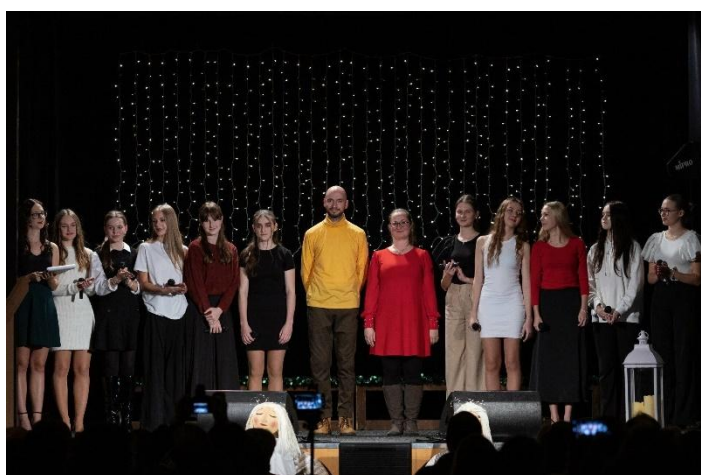
Vystoupení v pořadu Vánoce, Vánoce přicházejí