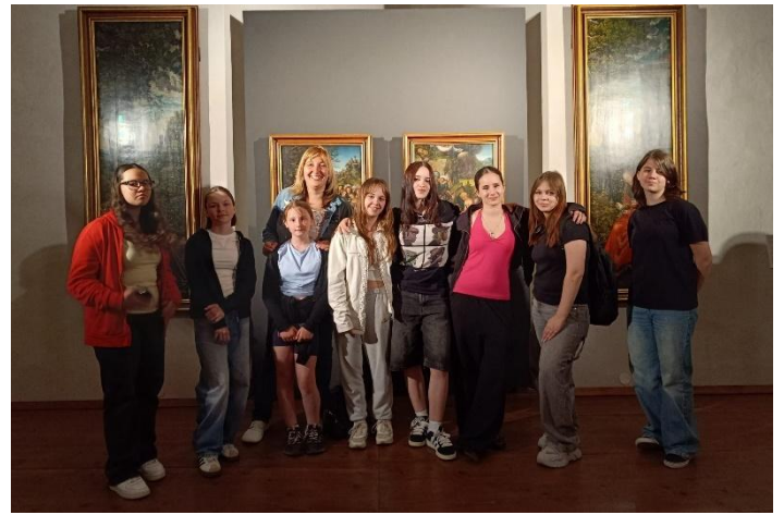
Jarní výlet do Kroměříže