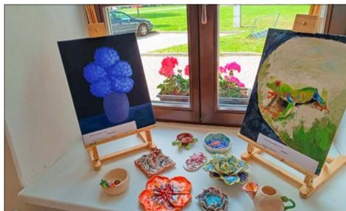
Výstava Barevný kaleidoskop v IC Hulín