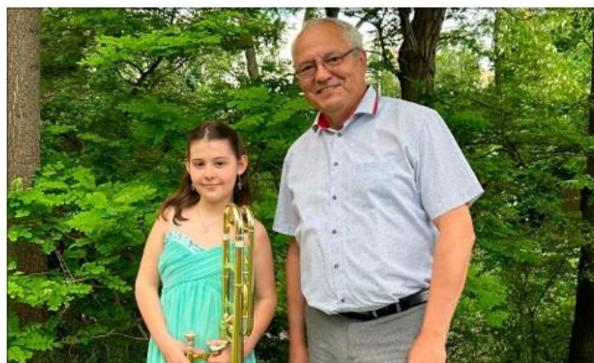
Ústřední kolo ve hře na žest'ové nástroje