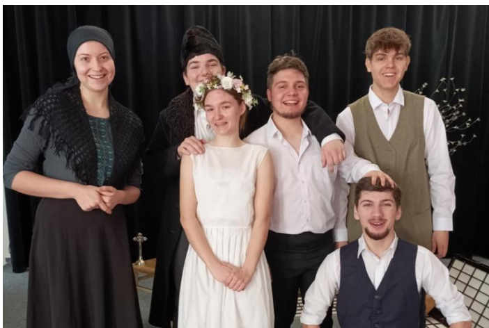
Divadelní představení Maryša