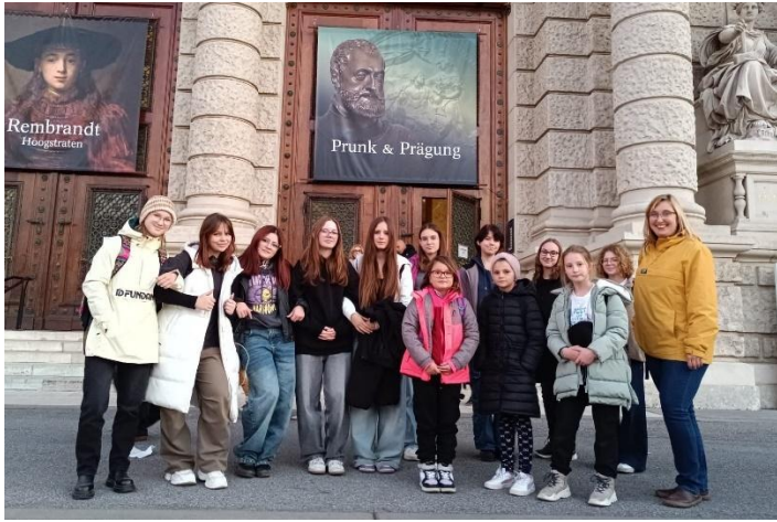
Podzimní výlet do Vídně