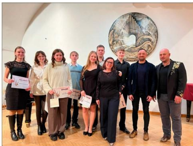
Okresní kolo ve hře na dřevěné dechové nástroje