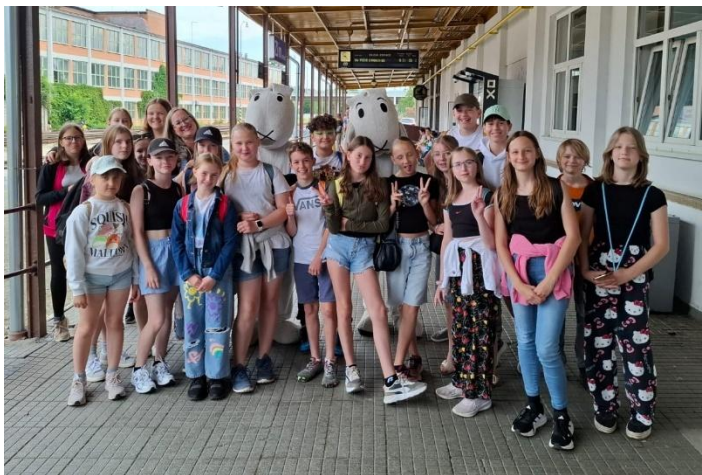
Filmový festival ve Zlíně