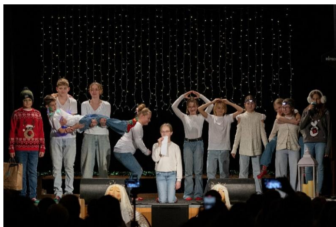
Vystoupení v pořadu Vánoce, Vánoce přicházejí