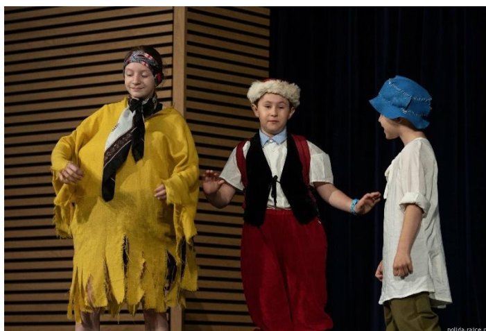
Hulínské pohádkové jaro