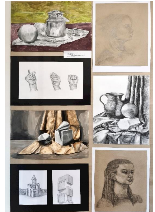
Absolventky výtvarného oboru a ukázka jejich prací