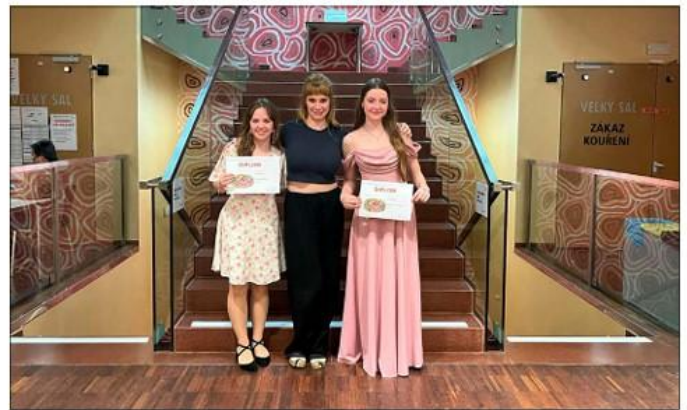
Ústřední kolo v sólovém zpěvu