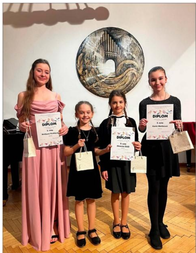
Okresní kolo v sólovém a komorním zpěvu