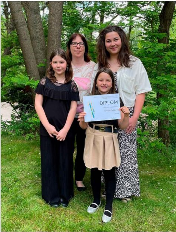
Ústřední kolo ve hře na zobcovou flétnu