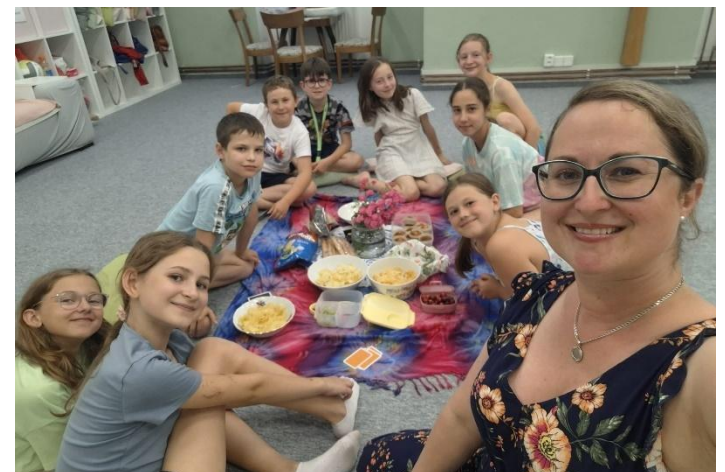
Rozloučení se školním rokem