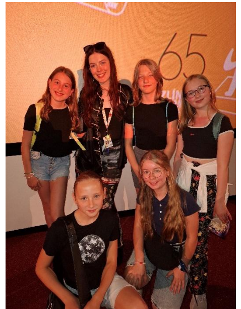
Filmový festival ve Zlíně