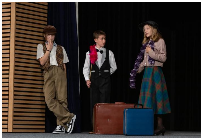
Hulínské pohádkové jaro