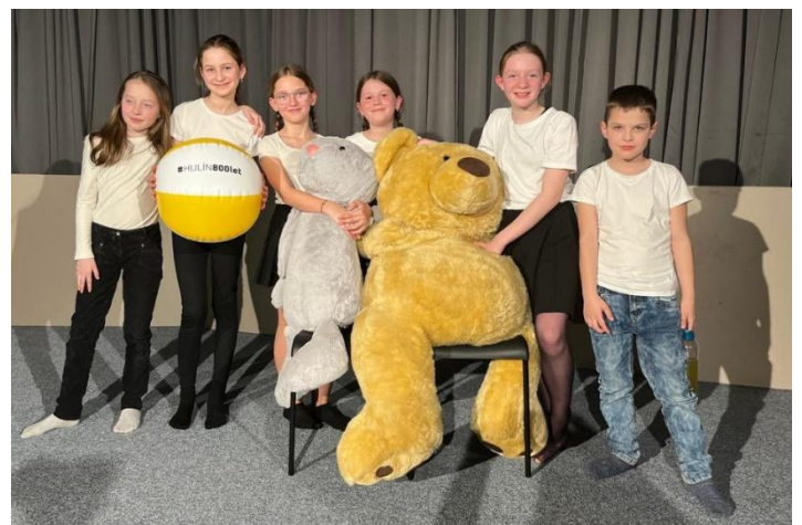
Ukázková hodina pro rodiče