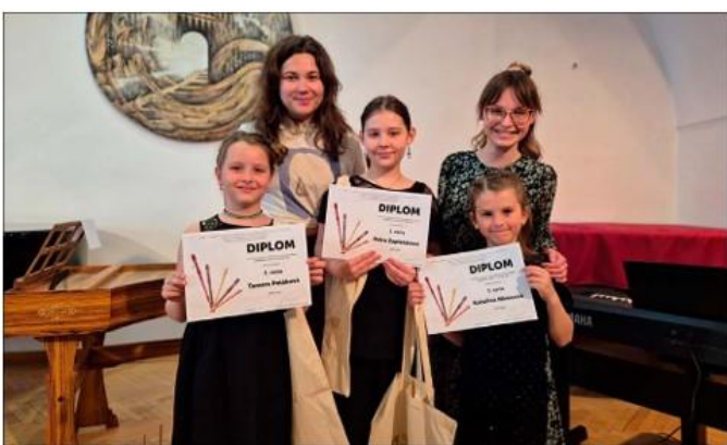
Krajské kolo ve hře na zobcovou flétnu