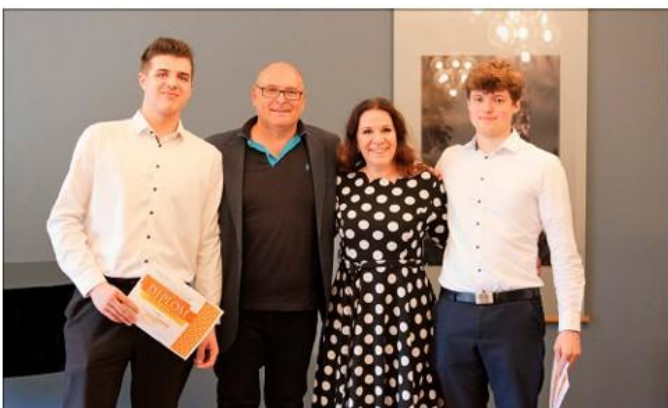
Krajské kolo ve hře na žest'ové nástroje