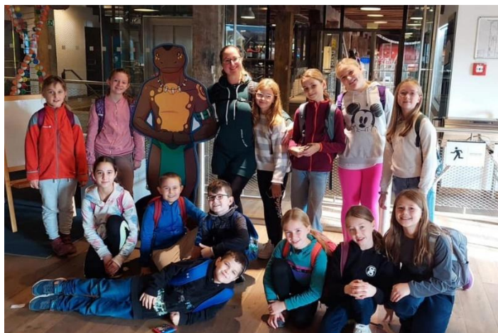
Výlet do Pevnosti poznání v Olomouci