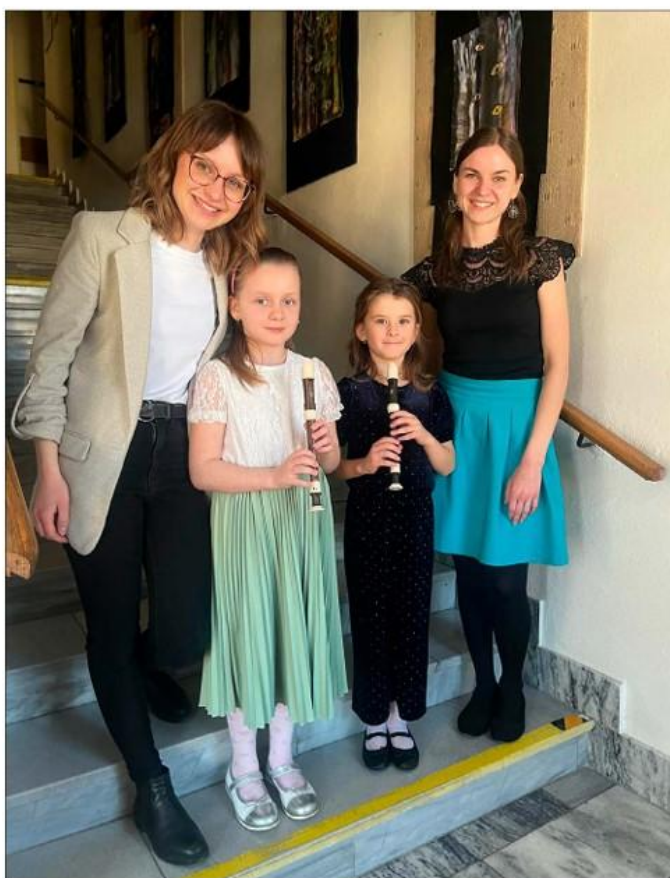
Okresní kolo ve hře na zobcovou flétnu