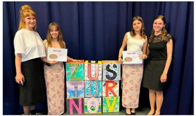
Ústřední kolo v komorním zpěvu