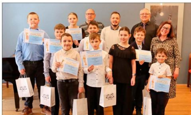
Okresní kolo ve hře na žest'ové nástroje