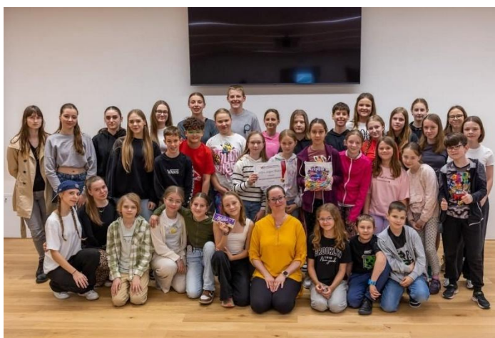
Hulínské pohádkové jaro