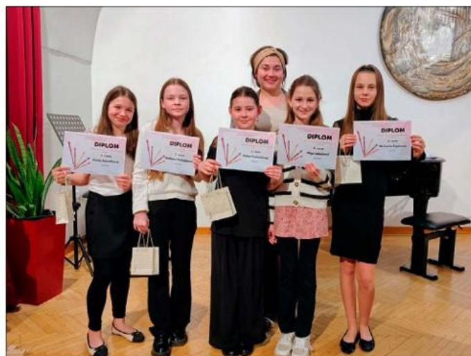
Okresní kolo ve hře na zobcovou flétnu