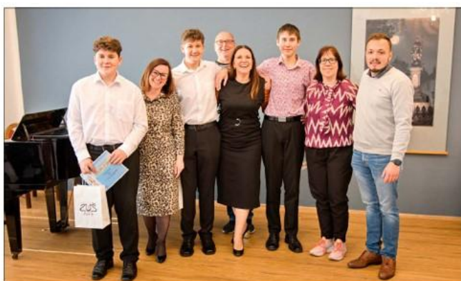
Okresní kolo ve hře na žest'ové nástroje